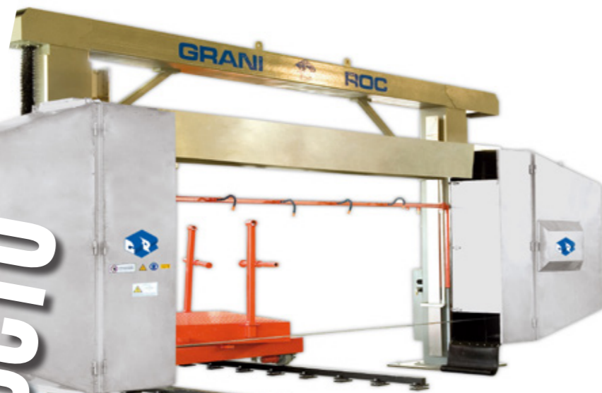
Máquina DUOMATIC de Grani Roc.

Tlf. (+34) 987 84 96 90 Mvl. (+34) 619 212 534 Fax (+34) 987 28 10 70 info@grupohedisa.com www.grupohedisa.com