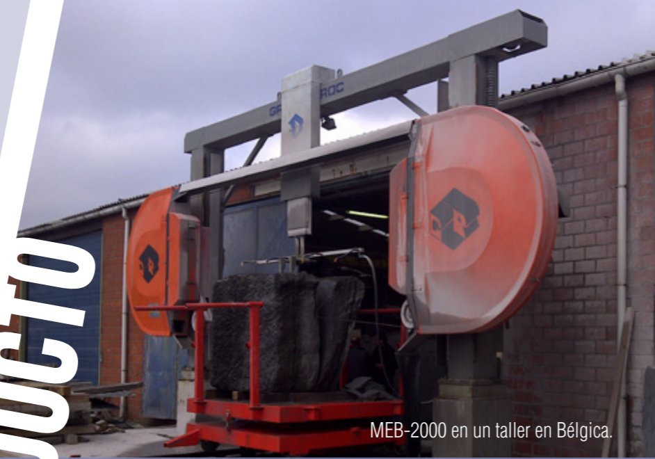
MEB-2000 en un taller en Bélgica.