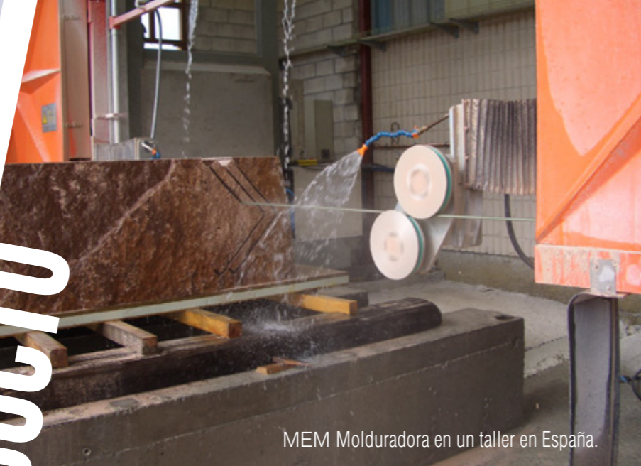
MEM Molduradora en un taller en España.